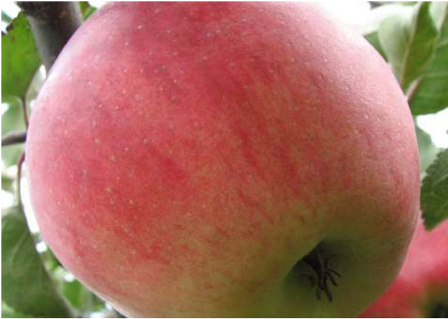
Abb. 6: Rekarda