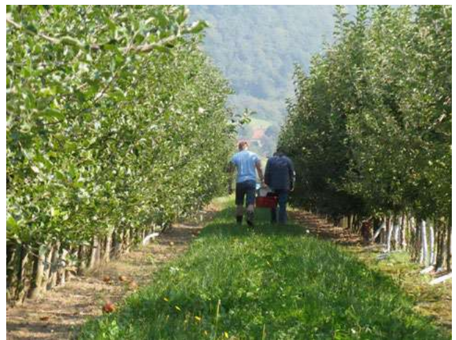
Abb. 1: Apfelanlage JKI Dresden-Pillnitz

Die Züchtung neuer Apfelsorten hat in Dresden-Pillnitz (Deutschland) eine lange Tradition. Verbunden mit der Gründung einer Höheren Staatslehranstalt für Gartenbau im Jahr 1922, wurden unter der Leitung Otto Schindlers erste Sortenzüchtungsprogramme bei Apfel, Apfelerlagen und Erdbeere initiiert (HANKE UND FLACHOWSKY 2017). Seit dieser Zeit wurde in Pillnitz fortlaufend an der Züchtung neuer Apfelsorten gearbeitet. Lediglich während der Zeit des zweiten Weltkrieges waren diese Arbeiten kurzzeitig unterbrochen. Einen besonderen Aufstieg erfuhr die Apfelzüchtung ab den frühen 1970er Jahren. Grund dafür war die Konzentrierung aller Arbeiten auf dem Gebiet der Obstzüchtung, die in der ehemaligen DDR durchgeführt wurden, in Dresden-Pillnitz. Im Rahmen dieser Konzentrierung wurden existierendes Zuchtmateriale und genetische Ressourcen aus dem Kaiser-Wilhelm-Institut für Züchtungsforschung in Müncheberg und der Biologischen Reichsanstalt für Land- und Forstwirtschaft in Naumburg an der Saale nach Pillnitz überführt. Hier prägen im Laufe der Jahre verschiedene Züchterinnen und Züchter die Apfelzüchtung und deren Ausrichtung in entscheidender Art und Weise. Zu ihnen gehörten neben Heinz Murawski vor allem Christa und Manfred Fischer sowie Barbara Dathe, Johann Schmadlack und Josef Salzer.