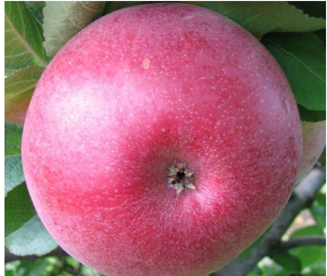
Abb. 4: Pingo

Aus den 567 Zuchtklonen, die aus Kreuzungen mit den Sorten, die vor 1931 entstanden sind, selektiert wurden, gingen neun Sorten (Tabelle 3) hervor, von denen sieben zum Sortenschutz angemeldet wurden. 'Pikora' und 'Pinett' wurden nicht zum Sortenschutz angemeldet. 'Pia Delight' hat seit 2020 Sortenschutz. Von den neun ausgelesenen Sorten haben vier die Sorte 'Golden Delicious' als einen Elter. 'Golden Delicious' ist die einzige Sorte, die vor 1900 entstand, aus deren Nachkommen Sorten ausgelesen werden konnten, die zumindest der Ansicht der Züchter nach, den Markterfordernissen entsprachen oder eine Nische im Markt abdeckten und somit die Kosten für die Sortenschutzprüfung rechtfertigten. Vier von 83 ausgelesenen Zuchtklonen von 'Golden Delicious' Kreuzungen entsprachen diesen Anforderungen. Die restlichen 222 Zuchtklone, die aus den Kreuzungen mit Sorten von vor 1900 stammen wurden allesamt verworfen. Auch von den Nachkommen von 'Bancroft' und 'Clivia' wurden Sorten ausgelesen (Tabelle 3). 'Bancroft' ('Forest' x 'McIntosh') ist ein Abkömmling von einem, der