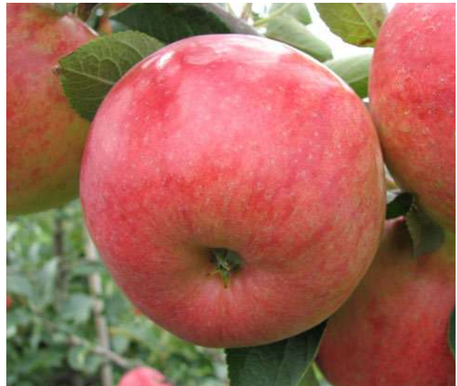
Abb. 5: Rebella