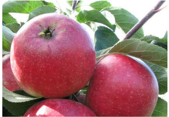
Abb. 7: Resi

von BANNIER (2011) beschriebenen sechs Stammeltern. Das gilt auch für 'Clivia' ('Geheimrat Dr. Oldenburg' x 'Cox Orangenrenette'). Hinzukommt, dass der jeweils andere Elternteil bei mindestens vier dieser sechs Sorten entweder 'Golden Delicious' war, oder einen der Stammeltern im Stammbaum hat. So hat die Sorte 'Remo' z. B. 'James Grieve' als einen Elter, während die Sorte 'Idared' ein Nachkomme der beiden Sorten 'Jonathan' und 'Wagnerapfel' ist. Aber auch für diese Sorten trifft zu, dass deren Nachkommen die einzigen unter 340 Zuchtklonen hervorgebracht haben, die sich am Ende durchsetzen konnten.